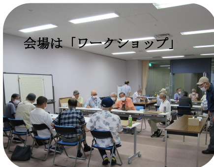
会場は「ワークショップ」