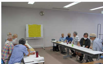
豊田チーム vs 本郷 B チーム

5名編成、総当たり3回戦、栄区の地域別に選抜した4チーム(20名)がエントリー。2チームが2勝1敗の同星だったが直接対局を制した「本郷Bチーム」が優勝の栄冠を手にした。