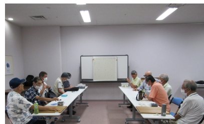
本郷 A チーム vs 上郷チーム

5名編成、総当たり3回戦、栄区の地域別に選抜した4チーム(20名)がエントリー。2チームが2勝1敗の同星だったが直接対局を制した「本郷Bチーム」が優勝の栄冠を手にした。