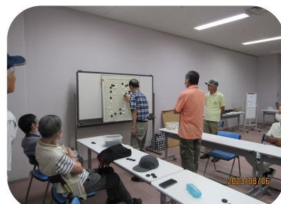
1人が1回に3手ずつ打つルール