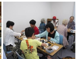
子供、レディ、シニアも