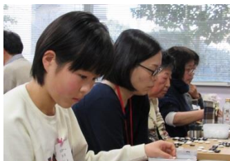
2度目の出場となった女流チーム:結果は今一つで残念だったが、新年に相応しく華やいだ雰囲気が会場に溢れた。