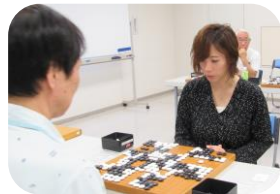
支部会員の熱心な活動に感心し、また来たいと！