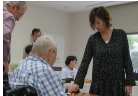
思いやりのある解説指導に皆大喜び！！