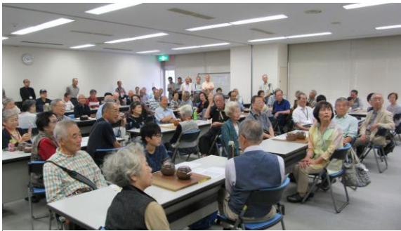
会場は、謝依旻プロのファンで溢れんばかり