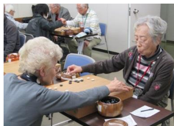
私はここに打つわ!