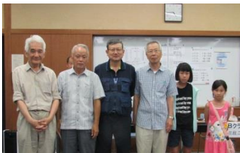
市対抗戦出場メンバー