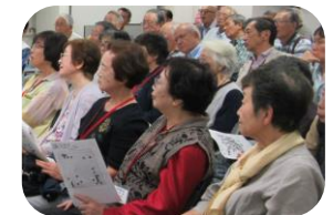
最前列は女性ファンでぎっしり！