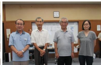
市段位戦出場メンバー