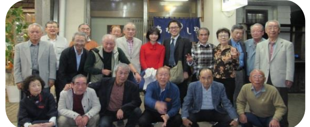
大会終了後の懇親会(後列中央が両プロ)