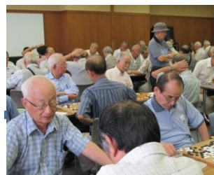
熱気一杯の対局場