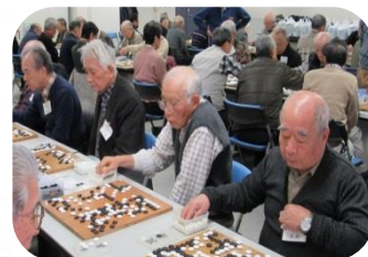
ワンチームで頑張る!

【Aブロック】優勝:湘南桂台囲碁愛好会 A 準優勝:上郷金 A 三位:湘南ハイツみどり会 敢闘賞:野七里囲碁クラブ