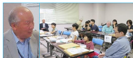
入門コース 保護者も交えて