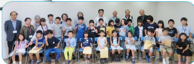
Dクラス 初めての午後までの熱戦が終わって・・・