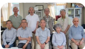
メンバーの方々 (7/21撮影)