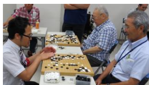
熱心に、丁寧に！ 両プロの指導碁