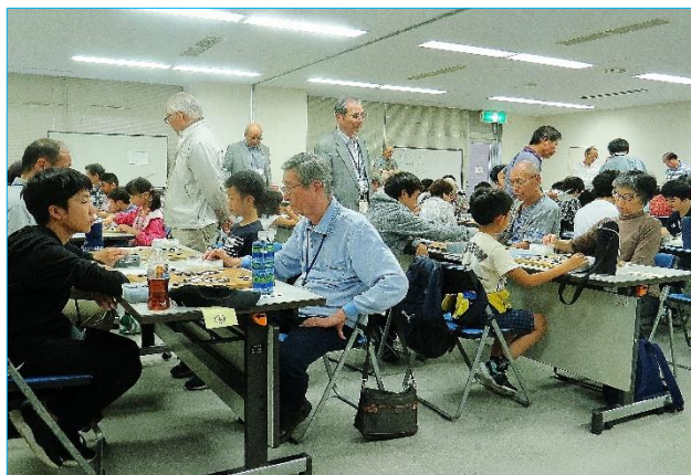
まさにこどもとおとなの熱戦！