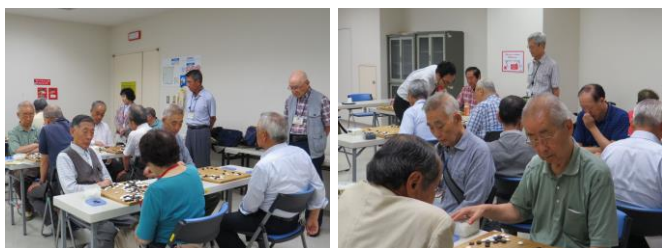
会員のための栄区内高段者による指導碁