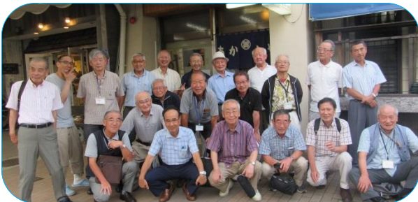
【幹事の皆さん、お疲れ様でした】