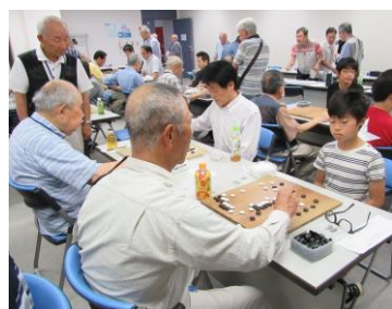
老いも若きも真剣に