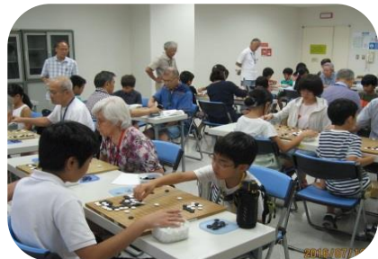
掲載された写真: 栄こどもとおとなの囲碁大会より

栄区囲碁4団体、「栄区囲碁普及会」「栄区囲碁連盟」「楽碁会」及び「日本棋院横浜栄支部」が連携・協力して取り組んでいる様子が、神奈川新聞7月4日号にタイトル:「ようこそ囲碁王国へ」普及に力」サブタイトル:「栄区の4団体、連携して活動」・「腕自慢よりも、底辺育てる」として、紹介されました。栄区囲碁普及会の幅広い年齢層の囲碁教室運営、小学校への囲碁普及活動等、囲碁を愛する人の底辺を広げる活動が取り上げられています。