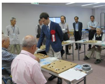
厳しい中に、優しさも