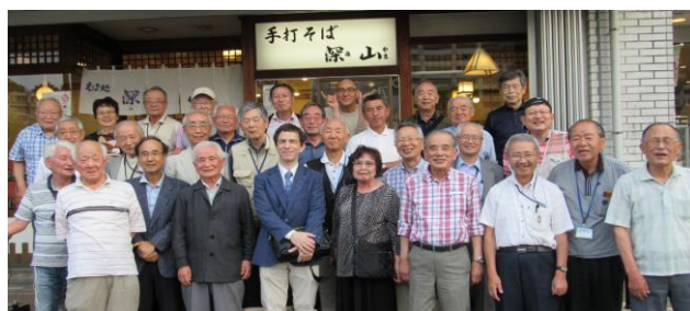
横浜栄支部・幹事の皆さん、お疲れ様でした