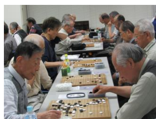
迫力の高段者対局

計78名が4クラスに分かれ各4局対戦した。表彰式では個人戦の表彰だけでなく、「隠れ団体戦」の表彰も実施された。