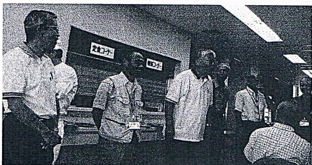
▲暑気より熱い囲碁への情熱

ター52名が参加して、軽い昼食を兼ねた懇親会が開かれた。全員の一言ずつの挨拶の中にも囲碁に対する熱い思いがこめられ、さすが囲碁を愛する仲間達の集いであった。そこかしこで囲碁談義に花が咲き、3時間があつという間に過ぎた。ここにインストラクターが語った『棋力向上のための体験アドバイス』を紙上再録しよう。