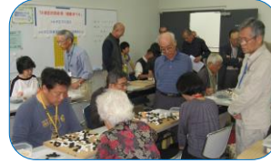
○Eクラス：19路盤（9-18級）参加・13名