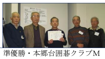
準優勝・本郷台囲碁クラブM