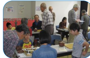
○初級クラス：13路盤（19-25級）参加・8名