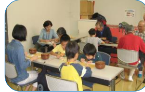
○初級クラス：9路盤（30-40級）参加・10名