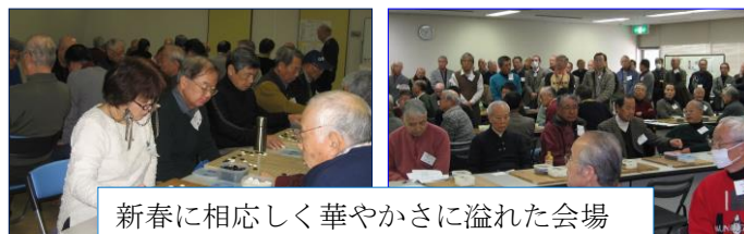
新春に相応しく華やかさに溢れた会場

栄区囲碁界は、今年も地域交流囲碁大会で幕を開けた。1月12日(月・祝)あーすぷらぎに150名余が集結し、新春の1日を満喫した。24チーム(5人編成)が<Aブロック>と<Bブロック>の各12チームに分かれ、各4局の対戦で優勝を目指した。