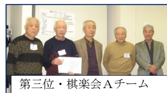
第三位・棋楽会Aチーム