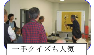
一手クイズも人気