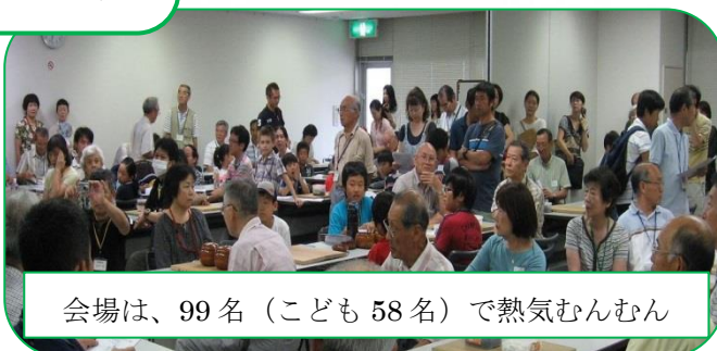
会場は、99名(こども58名)で熱気むんむん