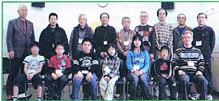
▲生徒さんたちとインストラクターの皆さん