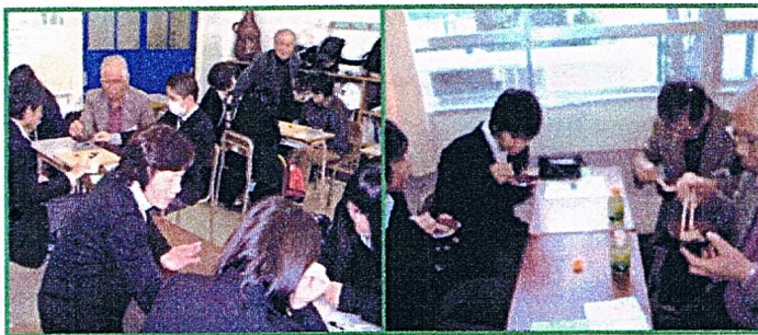
▲あちらこちらで密着指導

昨年12月17日、横浜栄高校で三世代交流会が開催され、碁碁体験教室には高校生20名が参加、碁碁ボランティア10名が指導した。さすが高校生諸君、2時間でマスターし、対局できるまでになった。8月3日には、豊田小学校「はまっ子夏休み碁碁教室」などに協力した。