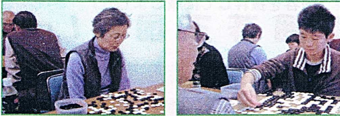
▲男性軍に混じって女性や子供の姿も増えた

栄区民文化祭・囲碁大会をはじめ6つの大規模な囲碁大会が開催されたが、栄区民芸術祭・囲碁まつりに過去最多の150名が参加するなど増加の一途をたどった。連盟と普及会の協力のもと入門クラスを設ける等、級位者クラスを拡充した事が大きかった。