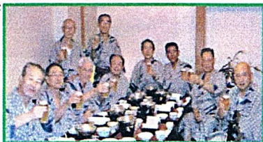
（熱戦後の一杯は格別！）

現在会員数26名で毎月第1,3,5日曜日と第4土曜日の午後1時から6時まで、町内会館にて点数製のシステムで真剣に対局を楽しんでいます。年間行事としては年1回の町内大会を主催、クラブ内では新春、納涼の親睦会を兼ねての大会、1月の勉強会、対外的には三町合同の他流試合、囲碁連盟主催の地域交流大会に2チームを編成し参戦している。昨年は優勝と3位の好成績を残した。又、昨年から1泊囲碁旅行も再開、十二分に囲碁とお酒を楽しむ催しとなりました。