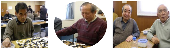
▲真剣な顔、顔、そして対局終わってホット一息