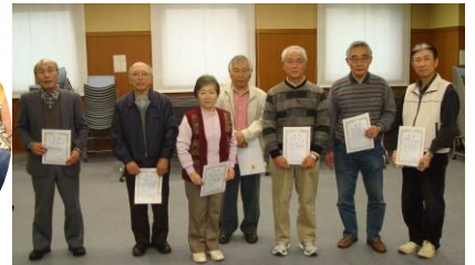
▲喜びの入賞者がズラーリ