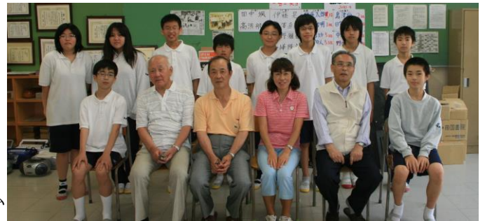
▲西本郷中の生徒諸君と徳丸顧問とインストラクター

7月11日の神奈川県中学校囲碁選手権大会（1チーム3名・学校対抗戦）を目指してガンバレ！