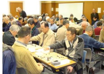
▲熱気あふれた会場

A（二段以上）、B（初段～3級）、C（4級～7級）の3クラスに分かれたが、全て互先で、勝数・勝局の目数が同じ場合は年長者を優先するのがシニア大会の特徴。