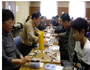
▲あちらこちらで子供と女性の対局。囲碁人口の広がりを感じる。